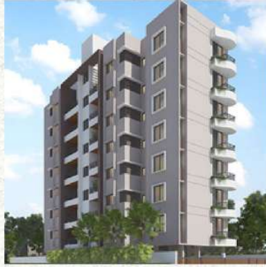
SK Paradise, काठे गल्ली