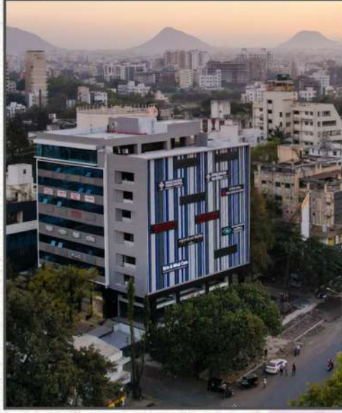
वेद मंदिर शेजारी, मायको सर्कल, नाशिक