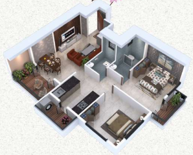
2BHK - Luxury