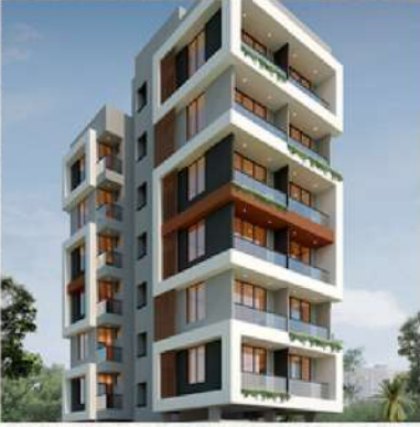
SK Blossom, तपोवन रोड