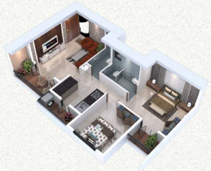
2BHK - Comfort