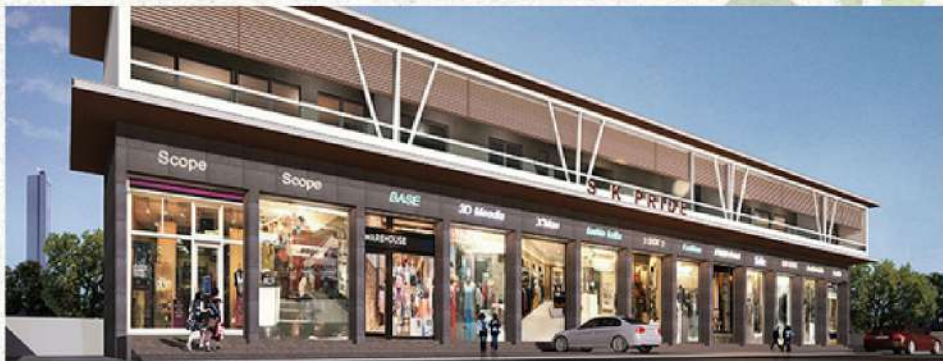
SK Pride, तारवालानगर, पंचवटी