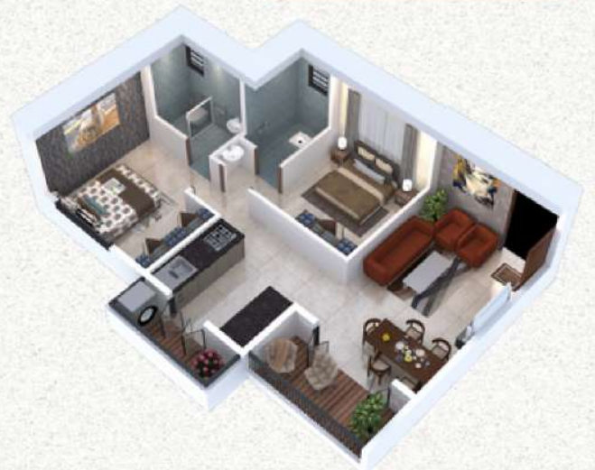
2BHK - Cozy